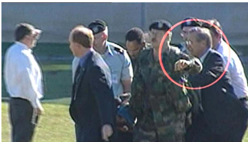
Donald Rumsfeld aide les secouristes devant le Pentagone et les caméras de la TV. N'avait-il pas mieux à faire ce matin là ?